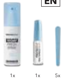
1x 1x 5x

This Instruction For Use was last revised in July 2018